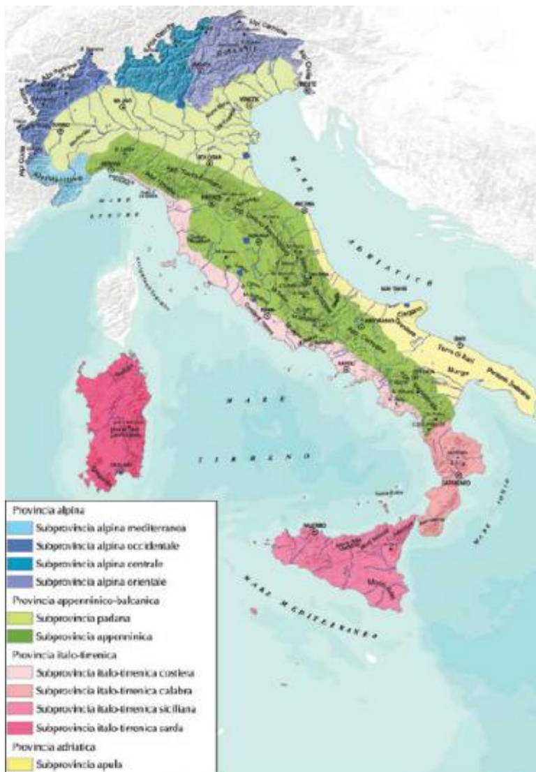
Figura 1. Carta biogeografica d'Italia.