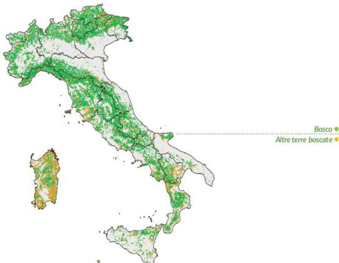
Figura 2 – Distribuzione geografica del patrimonio forestale nazionale