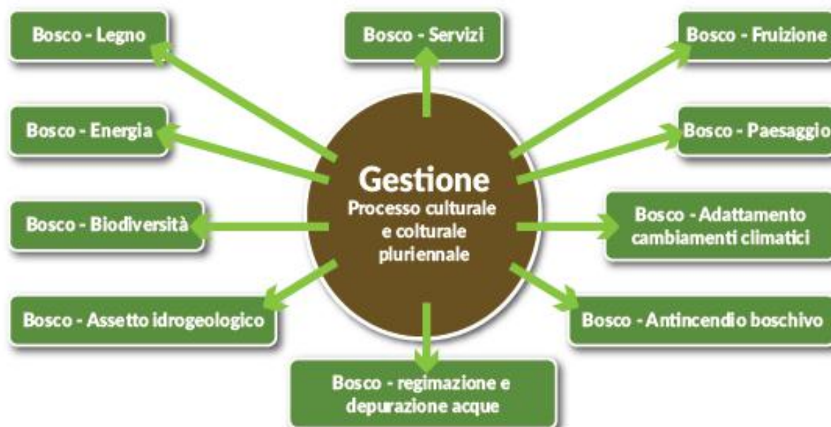
Figura 4 – Il ruolo della Gestione Forestale Sostenibile per le filiere forestali

La selvicoltura, quale strumento indispensabile nella gestione e tutela del territorio e del patrimonio forestale può contare oggi su competenze e conoscenze scientifiche e tecnologiche di altissimo livello. In particolare, grazie alla ricerca e al trasferimento delle conoscenze in ambito operativo si sono raggiunti importanti risultati in termini di innovazione tecnica e di prodotto, conservazione ambientale, efficientamento e sostenibilità ambientale ed economica degli interventi di gestione.